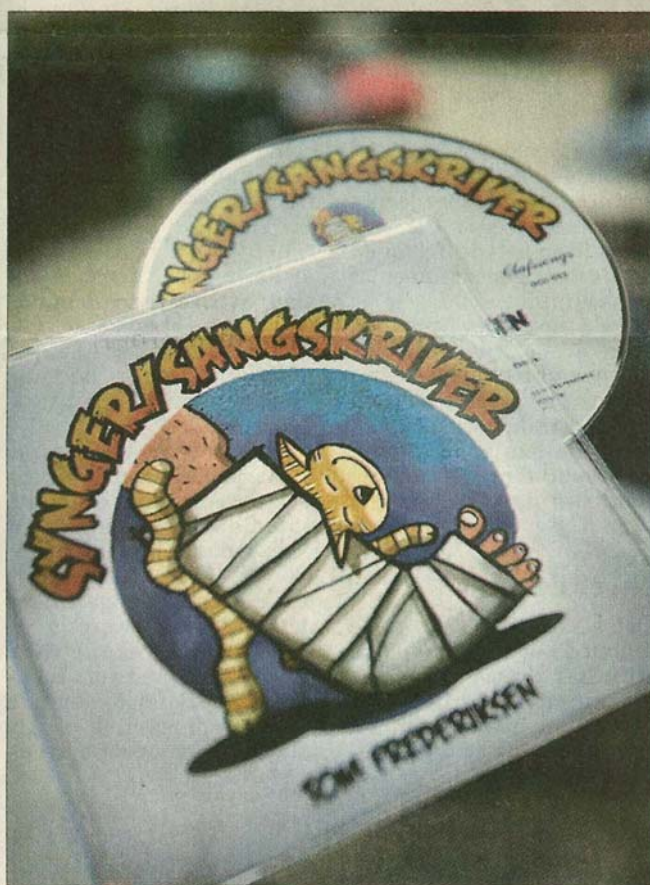
Coveret til Tom Frederiksens nye cd »Synger/sangskriver«.